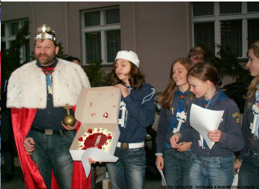
HOTANKA A WEB PŘÍSTAVU ORION