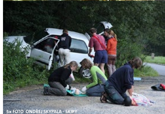
5x FOTO ONDŘEJ SKYPALA - SKIPY